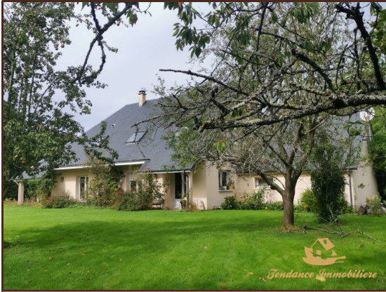
Coup de cœur

Référence VM1577, Mandat N°717 Belle construction traditionnelle édifée dans un cadre bucolique sur un terrain de 3785 m 2 au calme et à l'abri des regards comprenant au rez de chaussé, une entrée, une cuisine agencée et équipée, un séjour salon avec cheminée, une chambre avec salle de bain privative et wc.